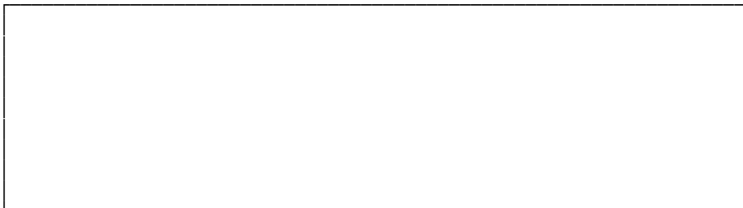
СХЕМА МЕСТНОСТИ С УКАЗАНИЕМ НАЗВАНИЙ УЛИЦ И НУМЕРАЦИИ СТРОЕНИЙ (для всех видов рекламных конструкций) масштаб 1:2000 (для рекламных конструкций на фасадах зданий - принципиальная схема размещения)